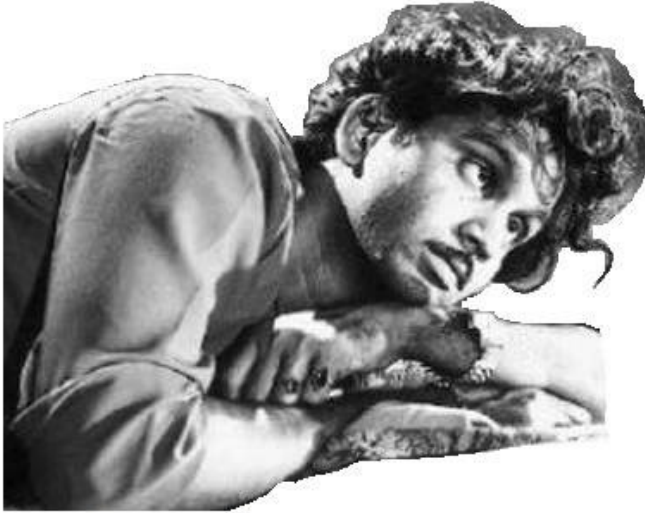
"వేదాన్తం" వేదాన్తం (1953)