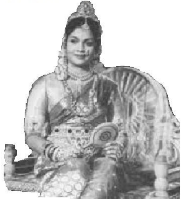
"శ్రీకృష్ణ వేణు" వేణు (1963)