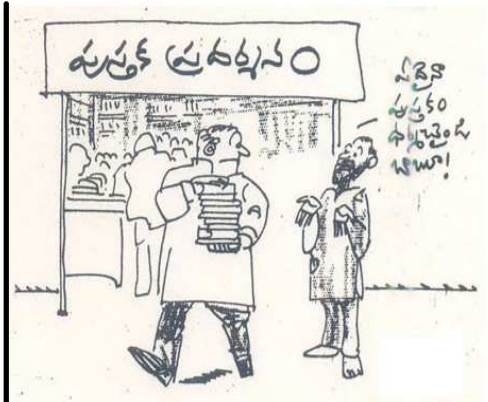
బుజ్జాయి కార్టూన్లు - ఇంటర్ నెట్ నుంచి (బుజ్జాయి గారికి కృతజ్ఞతలతో)