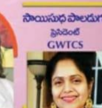
సాయిసుధ పాలడుగు ప్రెసిడెంట్ GWTCs