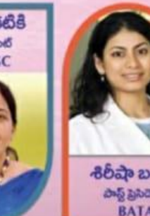
ఉమ కటికె ప్రెసిడెంట్ TAGC