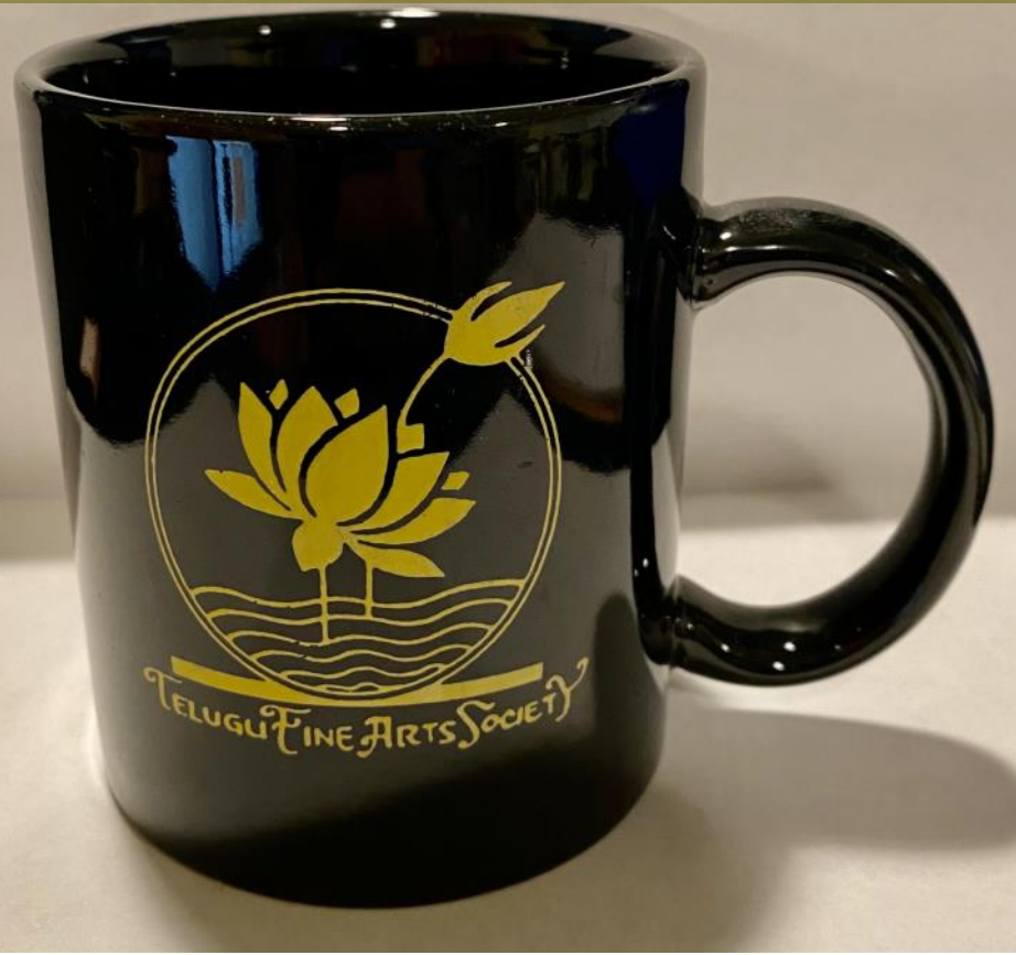
First TFAS Souvenir distributed to members in 1984

నందబాలా, భ్రమరాంబా నోట మాట రాక మౌనం దాల్చారు! అందమైన అక్కలు పనిజేస్తున్న కాలేజీలో తమ్ముళ్ళు చదువుకోకూడదు.