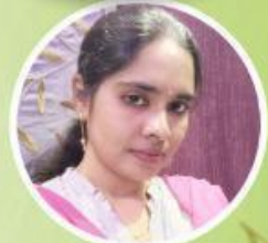
Bharathi Bellamkonda Singer