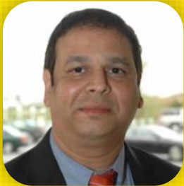
Anand Paluri Chair