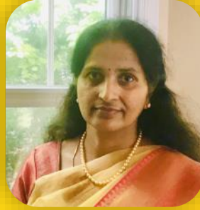
Anu Para Cultural Chair