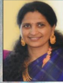
Anuradha Para Cultural Chair